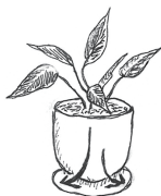
穴ありプランター